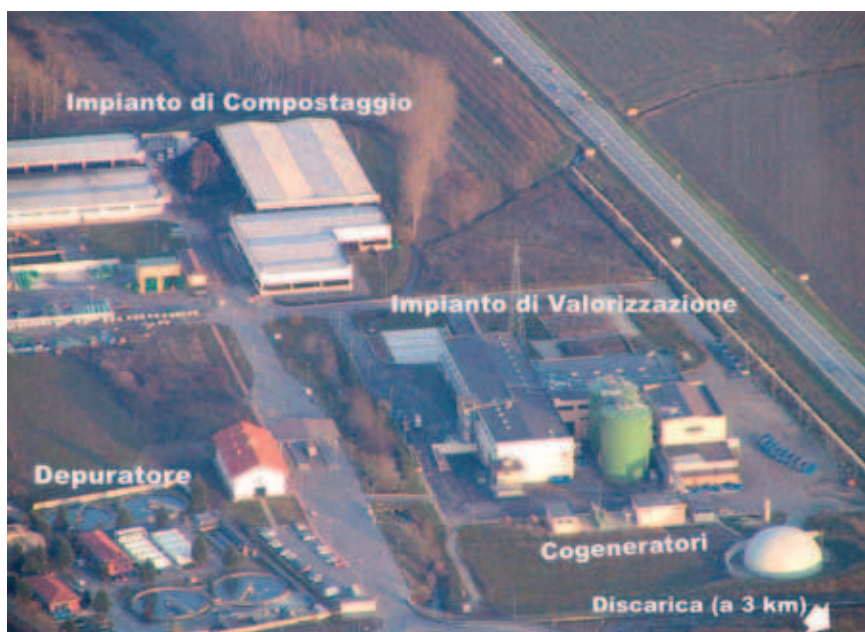
Figura 1. Il Polo Ecologico Integrato – veduta

L'intera attività della linea di lavorazione della frazione organica è orientata al processo di digestione anaerobica. Tutte le fasi preliminari, di carattere meccanico e biologico, sono volte, infat-