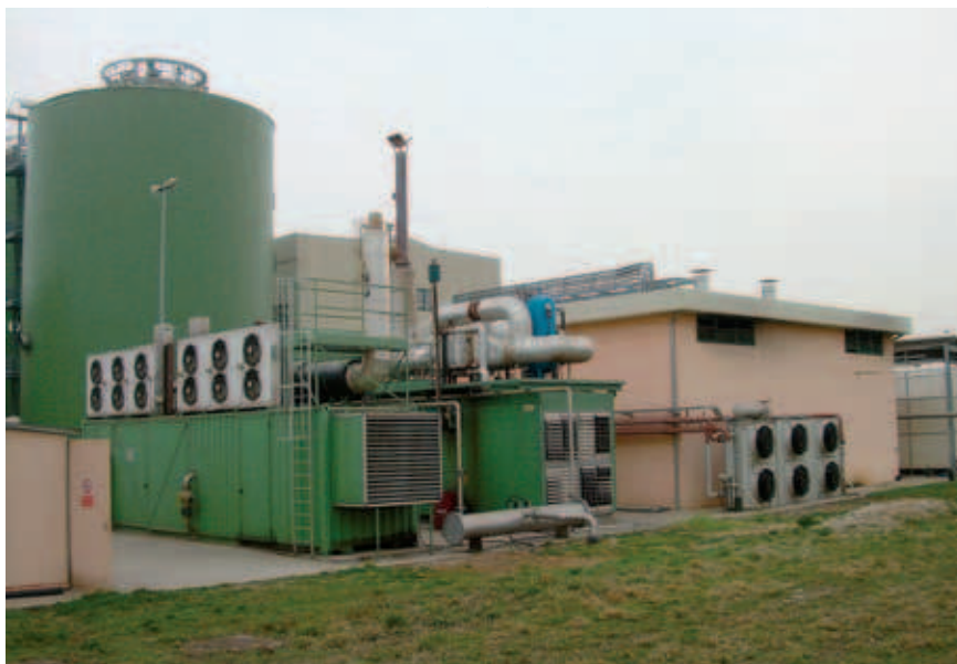
Figura 2. La centrale di cogenerazione Acea

ti, alla preparazione della massa al trattamento anaerobico.